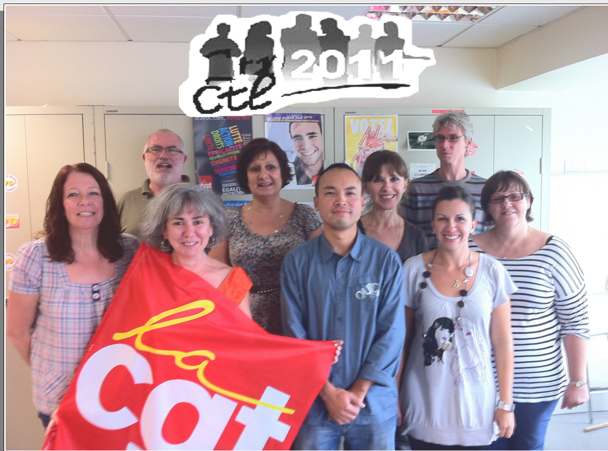
Des candidats de la liste CTL

Vos candidats sont des femmes et des hommes, à parité, des militants expérimentés représentant véritablement tous les services des deux filières de la DDFIP.