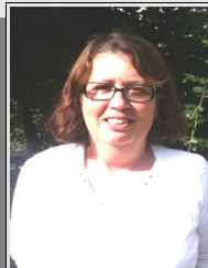
BRETEL Mercedes Pôle CE Argenteuil