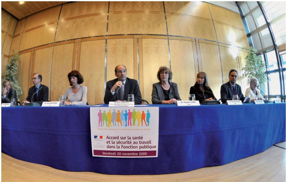
Le ministre, Eric Wœrth, avec des signataires de l'accord, le 20 novembre 2009.

Pour chaque axe, des indicateurs sont établis afin d'évaluer l'atteinte des objectifs fixés.